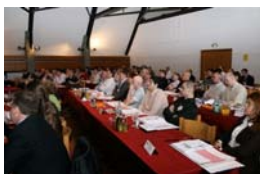
izobraževanje na EBRO

IZOBRAŽEVANJE V TUJINI dovolj povedano – samo še slike