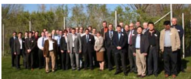
skupinska slika - INOR meeting